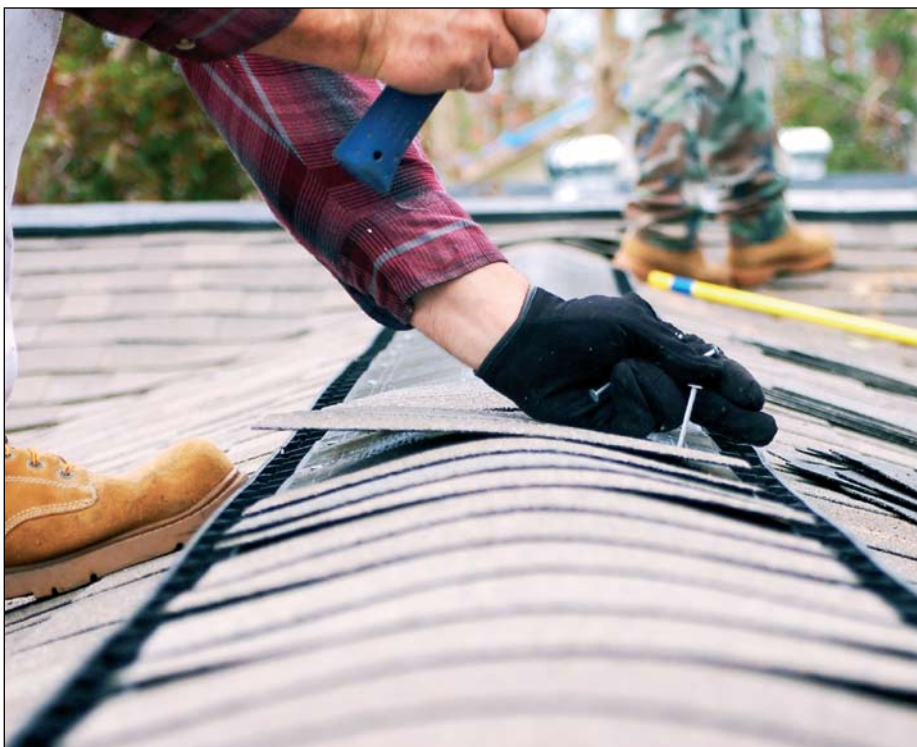
Nespėję atlikti visų būtinų darbų laiku, paramos gavėjai iki sutartyje ar paraiškoje nustatytos mokėjimo prašymo pateikimo dienos gali kreiptis į NMA

Pavėlavus informuoti NMA apie mokėjimo termino atidėjimą, mokėjimo prašymas dar gali būti priimamas 25 darbo dienas po numatytos sutartyje ar paraiškoje datos. Tei-