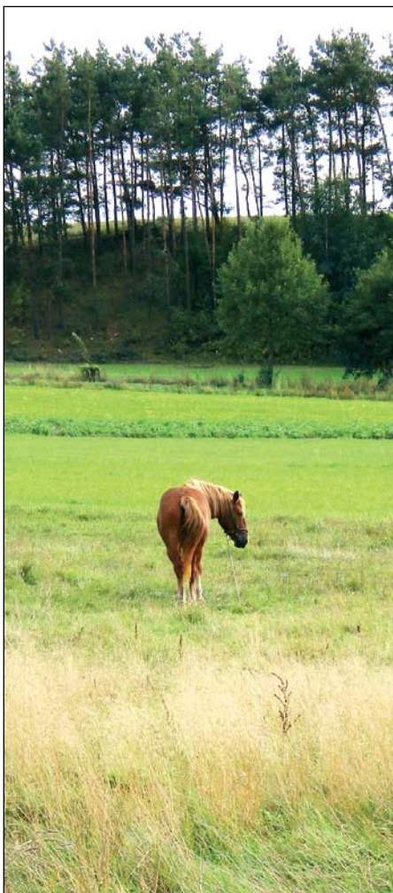
Konsultacijų metu ūkininkai gali pasitikrinti, ar atitinka geros agrarinės ir aplinkosaugos būklės reikalavimus

Kaip ir iki šiol, lieka penkios veiklos sritys, pagal kurias ES lėšomis remiamos konsultacijos. Pagal pirmąją veiklos sritį konsultuojama dėl ūkio atitikimo teisės aktų nustatytiems valdymo bei geros agrarinės ir aplinkosaugos būklės (GAAB) reikalavimams, darbo saugos standartams, pagal antrąją veiklos sritį – dėl valdymo ir GAAB reikalavimų neatitikimų ar pažeidimų pašalinimo, darbo saugos standartų, grindžiamų Bendrijos teisės aktais, įgyvendinimo, pagal trečiąją veiklos sritį – agrarinės aplinkosaugos klausimais konsultuojami asmenys, dalyvaujantys ar ketinantys dalyvauti agrarinės aplinkosaugos priemonėse, pagal ketvirtąją – buhalterinės apskaitos tvarkymo, pagal penktąją – miškų ūkio veiklos klausimais.