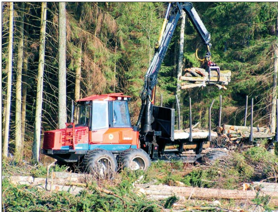
ES lėšomis remiamas ir medienos ištraukimo traktorių įsigijimas

Palengvėjus verslo plano rengimui, keičiasi ir tinkamų finansuoti projekto bendrųjų išlaidų dydis – finansuojama bendrųjų išlaidų suma be pridėtinės vertės mokesčio negali viršyti 10 tūkst. litų.