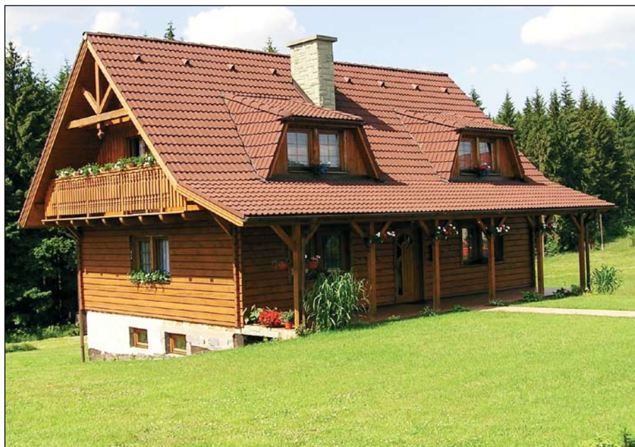
Kaimo turizmas – viena iš labiausiai būsimus pareiškėjus dominančių sričių

Taip pat galima atvykti į centrinę NMA būstinę Vilniuje. Asmenys, norintys pasikonsultuoti su Informacijos teikimo skyriaus specialistu, gali kreiptis pirmadieniais ir trečiadieniais nuo 8 val. iki 18 val., antradieniais ir ketvirtadieniais nuo 8 val. iki 17 val., penktadieniais nuo 8 val. iki 15.45 val. Pietų pertrauka visomis dienomis nuo 12 iki 12.45 val.