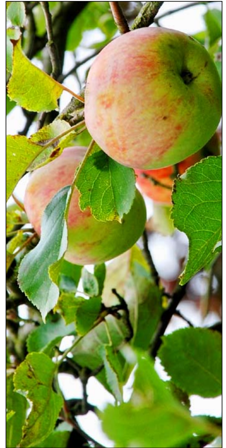
Šiemet vaisių derliaus laukiama žemesnio nei vidutinio

Pirminiai duomenys rodo, kad vien aplink Vilnių ir Kauną nustatyta 250 nedarbomos dirvonuojančios žemės savininkų. Remdamiesi pateikta informacija, Nacionalinės mokėjimo agentūros prie Žemės ūkio ministerijos