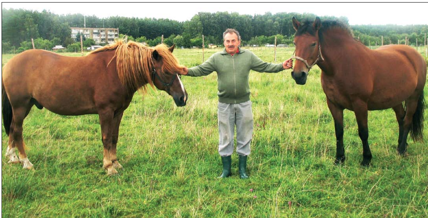
Pasak Vido Kuloko, tradiciškai pirma kumelaitės vardo raidė turi būti jos motinos pirmoji vardo raidė, o eržiliuko – tėvo