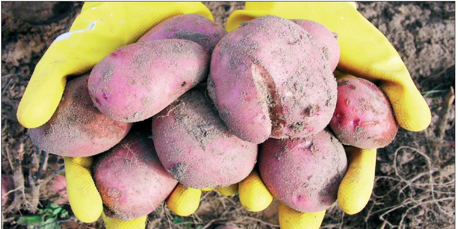
Ūkininkai vylėsi, kad baigiantis rudenii bulvių paklausa išaugs, o kaina padidės apie 15–20 centų