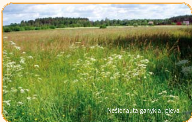
Nešienauta ganykla, pieva

● Ganyklos arba pievos, taip pat daugiametės ganyklos arba pievos turi būti naudojamos gyvuliams ganyti arba ne rečiau kaip kartą per metus (iki rugpjūčio 1 d.) nušienaujamos.