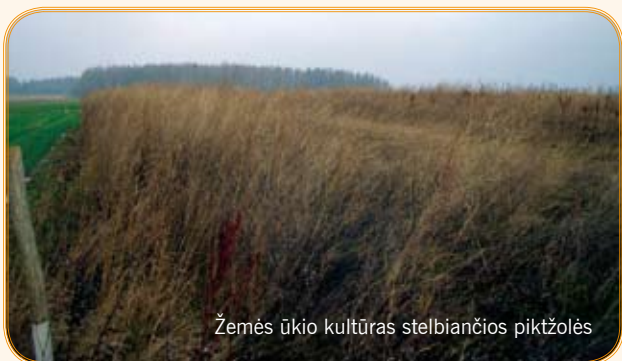
Žemės ūkio kultūras stelbiančios piktžolės

● Žemės ūkio augalų laukuose neturi būti juos stelbiančių piktžolių; juodąjį pūdymą reikia periodiškai įdirbti arba naudoti chemines priemones.