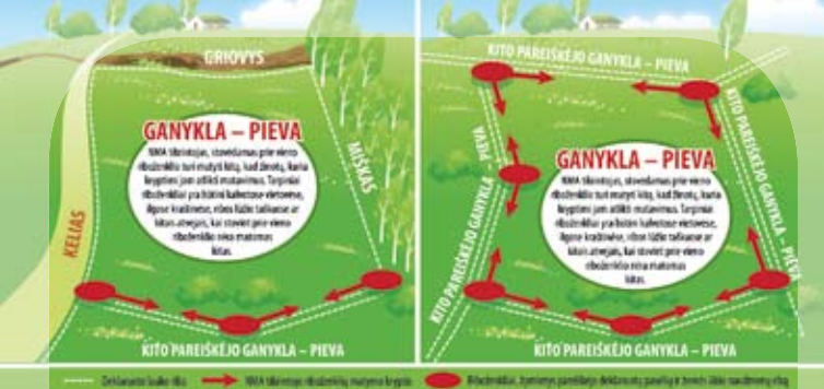
Riboženklų išdėstymo schema

vietoje metu neradus aiškių deklaruoto lauko ribų, laukas laikytinas nesančiu ir pareiškėjui taikomos sankcijos dėl neteisingo deklaravimo.