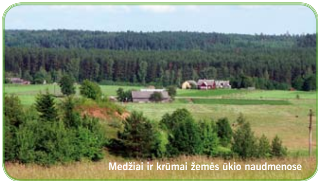
Medžiai ir krūmai žemės ūkio naudmenose

● Ariamoje žemėje bei ganyklų arba pievų, taip pat daugiamečių ganyklų arba pievų plotuose neturi būti medžių ir krūmų.