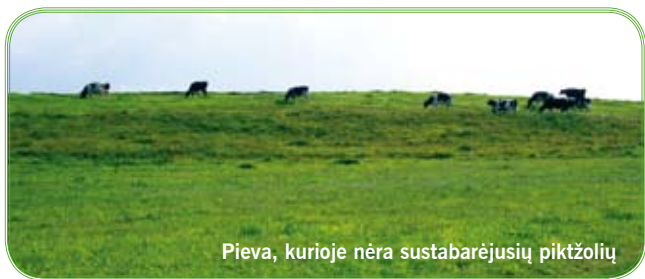
Pieva, kurioje nėra sustabarėjusių piktžolių

● Ganyklų arba pievų, taip pat daugiamečių ganyklų arba pievų plotuose neturi būti sustabarėjusių, sėklas subrandinusių piktžolių.